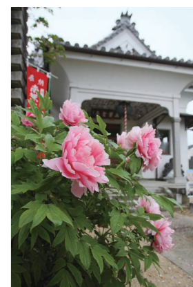
牡丹の美しい札所15番「少林寺」